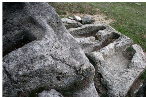
Necrópolis visigoda del Bodonal