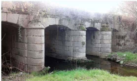
Puente sobre el arroyo Bodonal

Estos puentes fueron construidos a mediados del siglo XVIII conjuntamente con otros dos más que se encuentran dentro de la finca del monte de Viñuelas. Ambos tienen características similares y que, mediante sillería de granito muy elaborada, les permite presentar una gran elegancia arquitectónica. Los dos puentes se encuentran bajo el camino de la Moraleja (camino a Burrolandia) y a una distancia de unos 100 m entre ambos. De esta misma época es el puente de la Mamota sobre el río Manzanares