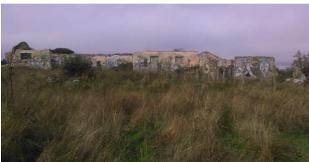
Ruinas de la casa “Vega del Registrados

En las ruinas actuales se pueden ver lo que fue una ermita-capilla, vivienda, almacenes, cuadras y bodega.